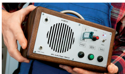
▲ MP3 PŘEHRÁVAČ. Pro ty, kterým vadí zbytečné funkce.