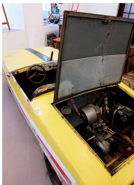
▲ AUTO. Pochází nejspíše z 80. let, motor je ze skútru.