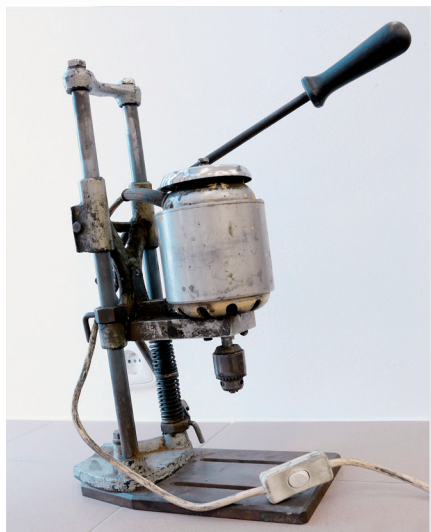
▲ VRTAČKA. Pochází z 80. let, motor je z mixéru.