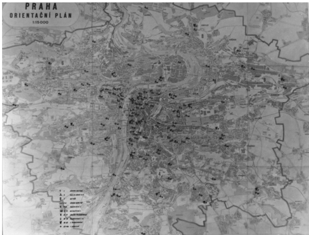
Mapa pražských bohoslužebných miest v polovine šedesátých let 20. století – reprodukce z rukopisu